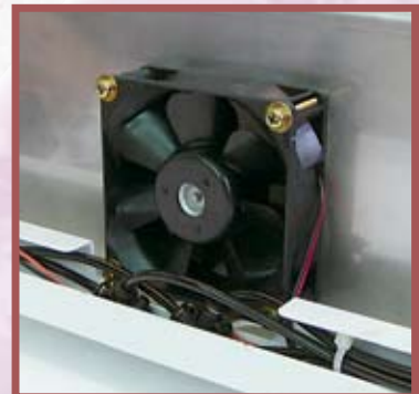
プリヒーター機能のファン